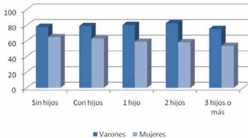
Tasa de empleo por sexo y nº de hijos