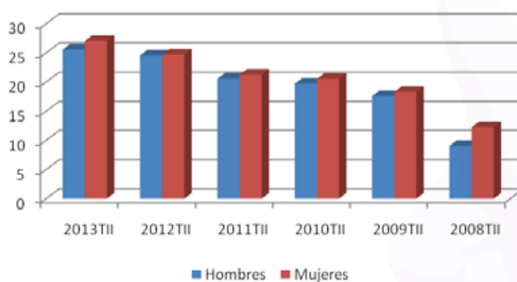
Tasa de paro por sexo

Elaboración propia con datos extraídos de la EPA