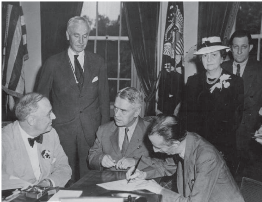
El Director General de la OIT Edward Phelan y el Presidente de los Estados Unidos Franklin D. Roosevelt firman la Declaración de Filadelfia, en la Casa Blanca, 1944.

ideológica y programática sobre la cual la OIT pudo asegurar su lugar en el orden que se estableció en la posguerra, como consecuencia de factores que sus dirigentes y sus partidarios más devotos solo pudieron controlar parcialmente.