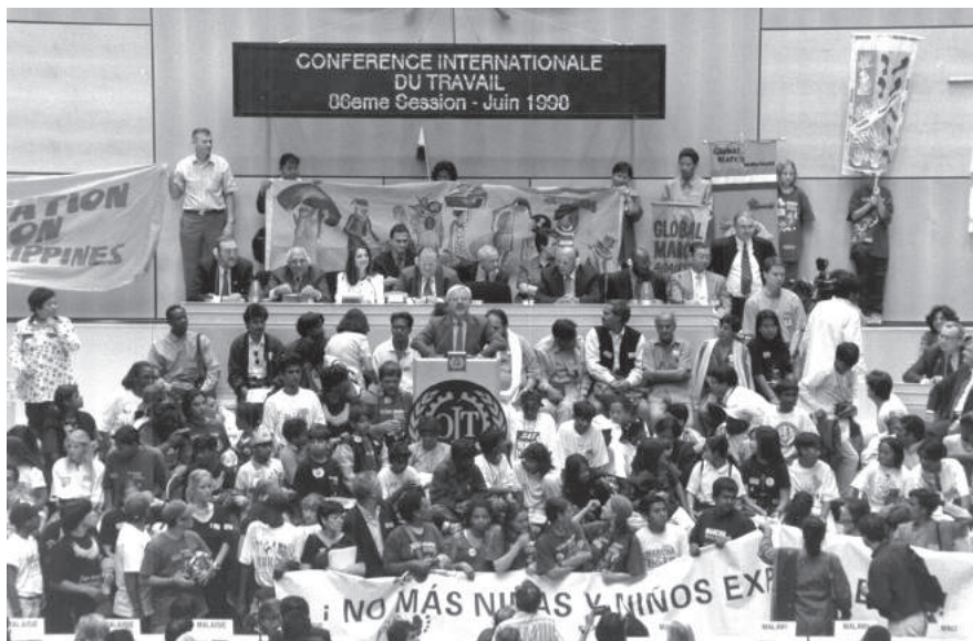
El Director General de la OIT Michel Hansenne da la bienvenida a la Marcha Mundial contra el Trabajo Infantil en la sesión de apertura de la CIT de 1998, en Ginebra.

los problemas de sus industrias exportadoras, lo que a su vez podría dar lugar a sanciones económicas. El hecho de que la puesta en marcha del IPEC coincidiera con los debates sobre la cláusula social y con campañas de boicot contra productos fabricados por niños exacerbaba los temores de los países en desarrollo. Los sindicatos, por su parte, pensaban que el programa terminaría siendo otro intento más de socavar las normas internacionales del trabajo y algunos trabajadores y gobiernos se oponían en términos generales por considerar que truncaba el objetivo de la OIT de eliminar por completo el trabajo infantil, consagrado en el concepto de edad mínima. Temían que una cooperación tan estrecha con organizaciones como el UNICEF o Save the Children pudiera restar claridad al mensaje de la OIT dado que ambas organizaciones defendían un enfoque más general del bienestar de los niños que no priorizaba la abolición del trabajo infantil propiamente dicha 677 .