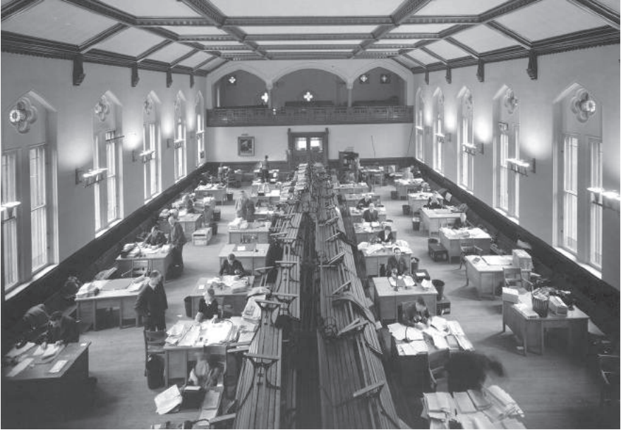
Morrice Hall, McGill University, Canadá, 1941.

nando más salas y mejoraron las condiciones. Sin embargo, lo más importante fue que la OIT mantuvo su libre albedrío. La estrategia de Butler y Winant de acercar la OIT a las Américas dio sus frutos y contribuyó a allanar el camino para la supervivencia de la Organización. Desde su base en Montreal, la OIT pudo retomar rápidamente la iniciativa. Gracias a sus excelentes contactos con el Gobierno de Roosevelt, el propio Winant desempeñó un papel decisivo, lo que permitió a la OIT renovarse. Winant se aseguró de que las misiones de asistencia técnica a América Latina continuaran sin interrupción a pesar del limitado presupuesto de que disponía la Organización 298 . Esta capacidad de acción, junto con la firme convicción de Winant de que la OIT podía desempeñar un papel decisivo «encabezando la libertad social y económica» en tiempos oscuros y que podía ser un instrumento para internacionalizar las políticas del New Deal, contribuyó significativamente a su supervivencia 299 . Todo ello compensó los puntos débiles del liderazgo de Winant, que muchos describieron como distante y errático, y que a veces rayaba en la negativa a comunicarse incluso con sus colaboradores más cercanos 300 .