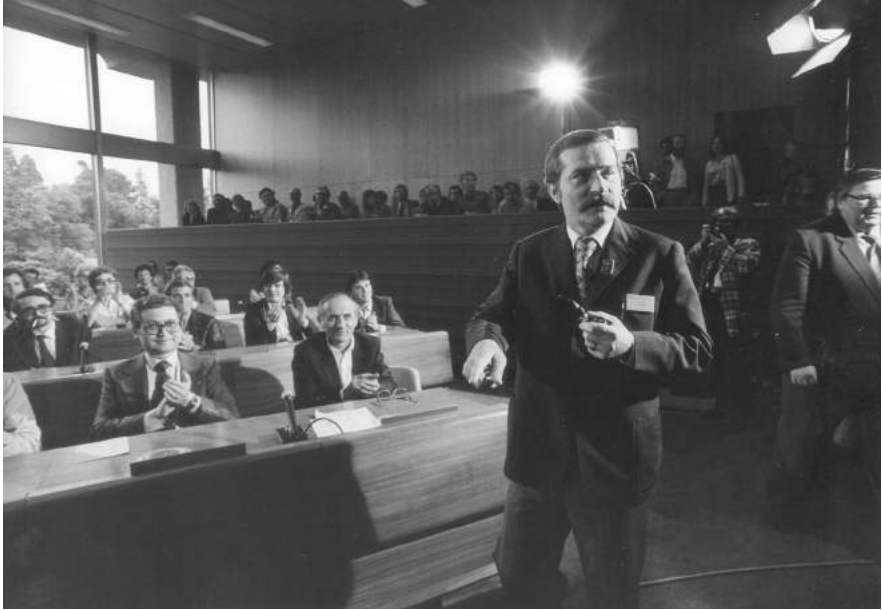
Lech Wałęsa ante la 67. a reunión de la Conferencia Internacional del Trabajo, 1981.

marzo de 1983, el Consejo de Administración decidió establecer una comisión de encuesta que concluyó que la proscripción de Solidarnosc carecía de fundamento jurídico. El Gobierno polaco, con el respaldo de otros países socialistas, reaccionó con gran indignación ante el informe de la comisión, que se presentó al Consejo de Administración en junio de 1984. En noviembre de ese mismo año, Polonia presentó una notificación anunciando su intención de retirarse de la OIT. En ese momento, a pesar de las continuas protestas del Grupo de los Trabajadores, la OIT adoptó una estrategia más laxa para evitar que Polonia abandonase la Organización. Las autoridades fueron atenuando progresivamente las restricciones impuestas por la ley marcial y, en 1986, Solidarnosc pudo volver a funcionar legalmente. Polonia aplazó su salida y al final terminó quedándose en la Organización 614 . Para entonces, el ritmo de los cambios en la región estaba marcado por la política de perestroika del nuevo líder soviético Mijaíl Gorbachov. Una de las consecuencias de este cambio fue que los representantes de los trabajadores del antiguo bloque comunista monolítico ya no estaban obligados a votar en la OIT de acuerdo con las políticas de sus gobiernos. Cuando, en 1989, Polonia se convirtió en el primer país del bloque del Este en poner fin al monopolio político del partido comunista y Solidarnosc ganó las primeras