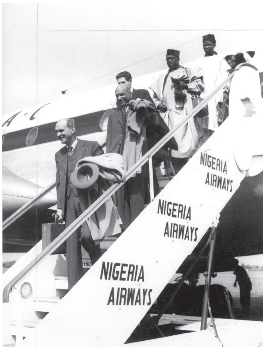
El Director General de la OIT David Morse llega a la Primera Conferencia Regional Africana, en Lagos, Nigeria, 1960.