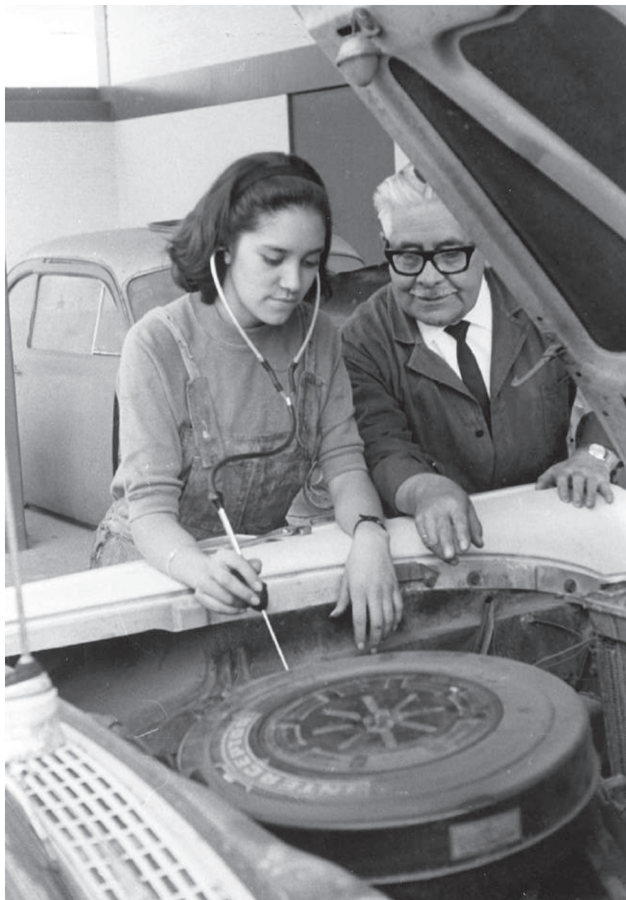
Curso de formación sobre mecánica del automóvil, Centro Internacional de Formación de la OIT, Turín, 1960.