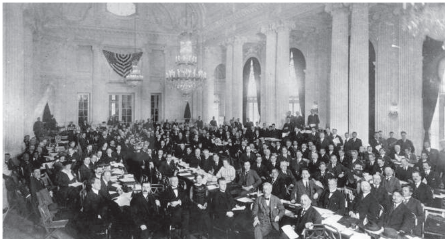
Primera Conferencia Internacional del Trabajo, Washington D.C., Estados Unidos, 1919.

los Estados Unidos por la OIT, así como la cooperación entre ambos; sin embargo, esta esperanza pronto se vio truncada. Al llegar a la capital de los Estados Unidos a finales de octubre de 1919, los organizadores enseguida se dieron cuenta de que ningún otro entorno habría resultado tan poco hospitalario para celebrar la Conferencia constitutiva de la Organización. A su vuelta de París, el Presidente Wilson había sufrido un accidente cerebrovascular, que mermó aún más su capacidad de influir en el debate. Unos días antes del encuentro, aún no se había obtenido el presupuesto de la Conferencia, y solo se consiguieron oficinas provisionales para celebrarla gracias a la intervención del entonces secretario adjunto de la Marina, Franklin Delano Roosevelt. En el Congreso, se acusó a los delegados europeos recién llegados de ser agitadores, y cuando finalmente se decidió que se celebraría la CIT, se supeditó a la condición expresa de que los Estados Unidos no se comprometerían a ingresar en la Organización 74 .