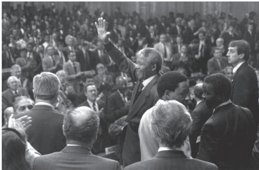
Nelson Mandela en la 77. a reunión de la Conferencia Internacional del Trabajo, 1990.

de los procesos que hoy se consideran bajo el concepto de «globalización» 632 . La globalización ha desencadenado un flujo de mercancías y capitales sin precedentes, que no ha parado de crecer, y ha ofrecido oportunidades de expansión a las empresas, pero al mismo tiempo ha limitado la capacidad de los Estados de controlar las fuerzas económicas que operan dentro de sus propias fronteras. Como consecuencia, los gobiernos –de mejor o peor gana– han renunciado a algunos de los medios de que disponían para alcanzar objetivos sociales y de empleo, bajo la premisa de que la globalización exige determinadas concesiones supuestamente irrefutables. Para la OIT, estos acontecimientos, y los debates que llevaban aparejados, entrañaban un peligro inminente. Ya a finales de la década de 1970 y en la década de 1980, algunas de las certezas –y, de hecho, los fundamentos y las premisas sobre los que se apoyaba la labor de la OIT desde la Segunda Guerra Mundial– comenzaron a desmoronarse. Si los gobiernos y las federaciones sindicales nacionales estaban perdiendo parte de su capacidad para definir el rumbo de las políticas económicas y sociales a nivel estatal, la OIT iba a perder también, necesariamente, parte de su influencia.