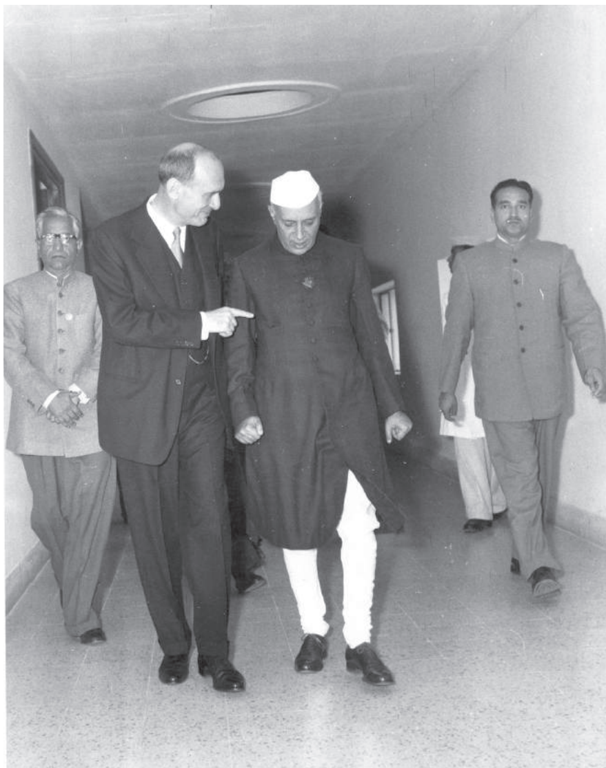
El Director General de la OIT David Morse con el Primer Ministro de la India Jawaharlal Nehru en la IV Conferencia Regional Asiática, en Nueva Delhi, India.