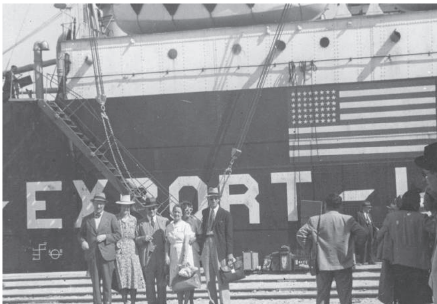
Lisboa, 1940: Grupo de miembros del personal de la OIT esperan a embarcar en un buque con rumbo al Canadá.

resto del personal de la Sociedad de las Naciones 296 , fue necesario despedir a la mayor parte del personal. En total, unos cuarenta miembros del personal de la OIT viajaron en secreto por territorio francés y español hasta Lisboa. Desde la capital portuguesa –donde miles de personas que huían de la persecución y la guerra esperaban desesperadamente poder embarcar hacia un refugio seguro en ultramar– este grupo de personal de la OIT consiguió por fin embarcar en el barco de vapor Excambion y salir de Europa rumbo a un futuro incierto.