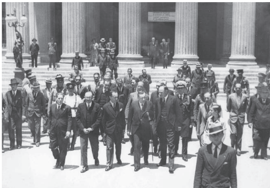
El Presidente chileno Arturo Alessandri Palma y el Director de la OIT Harold Butler (centro) al término de la sesión inaugural de la Primera Reunión Regional Americana, Santiago de Chile, 1936.