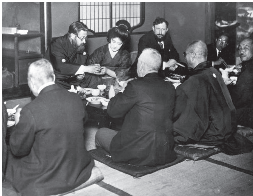
Albert Thomas, primer Director de la OIT (izda.), y el funcionario de la OIT Marius Viple durante su viaje al Japón en 1928.

reuniones anuales de la CIT, y proporcionaba muy poca información sobre su política laboral y social. Las repetidas solicitudes de la OIT para que China aceptase otras misiones de la OIT dirigidas a investigar el trabajo infantil y las condiciones laborales encontraron una resistencia aún mayor. Esta actitud no cambió hasta que el Gobierno nacionalista (Nanjing) asumió el poder en 1925. China fue modificando poco a poco su política, que se hizo más activa y previsor, y recurrió cada vez más a la OIT como espacio donde cumplir sus objetivos en materia de política exterior. Así, la ratificación de normas de la OIT formó parte de la estrategia para mejorar la posición internacional de China, en particular tras el comienzo de la guerra con el Japón, en 1932, y después de que el Japón abandonase la Sociedad de Naciones y la OIT el año siguiente. China fue elegida para ocupar un puesto en el Consejo de Administración por primera vez en 1934 y se convirtió en miembro permanente en 1944 202 .