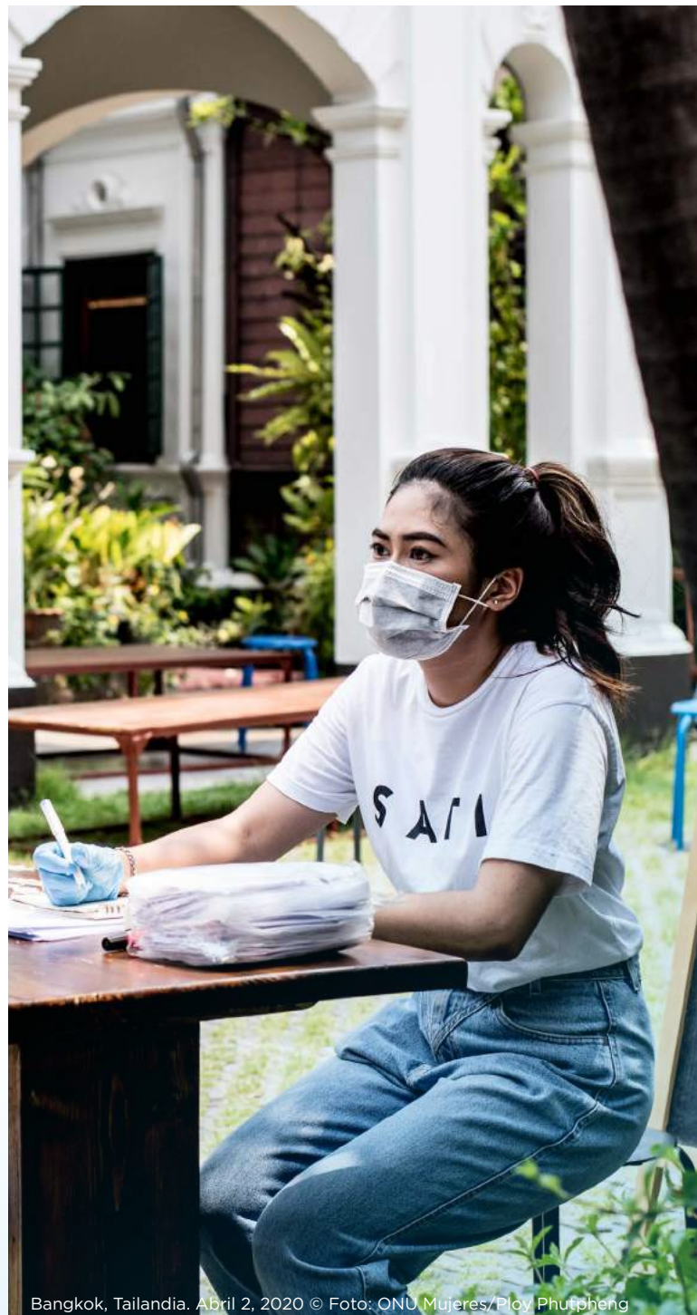
Bangkok, Tailandia. Abril 2, 2020

Los parlamentos deberían aprovechar la oportunidad que ofrece la pandemia para reflexionar sobre la sensibilidad de género de su respuesta a la crisis, y hacer cambios cuando sea apropiado.