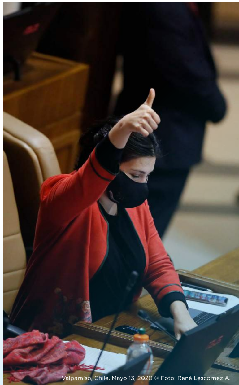
Valparaíso, Chile. Mayo 13, 2020